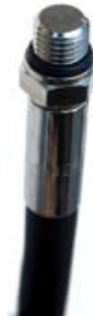
Abb. 2: Anschluss eines HD-Schlauchs mit Gewinde zur Verbindung mit einem HD-Ausgang der ersten Stufe, Gewinde 7/16“.