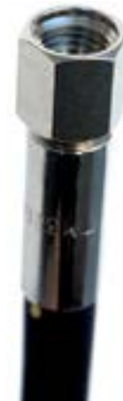
Abb 5: HD-Schlauchanschluss für Finimeter