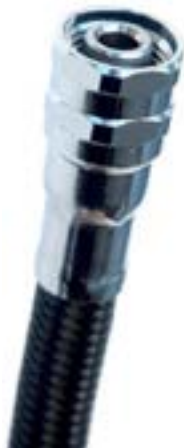
Abb 3: MD-Schlauchanschluss zur Verbindung mit einer zweiten Stufe