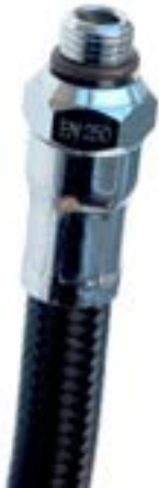
Abb. 1: Anschluss eines MD- oder INF-Schlauchs mit Gewinde zur Verbindung mit einem MD-Ausgang der ersten Stufe, Gewinde 3/8“: